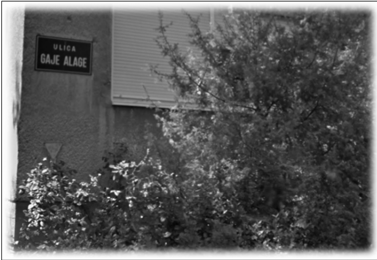
Slika 1. Ulica Gaje Alage u Zagrebu