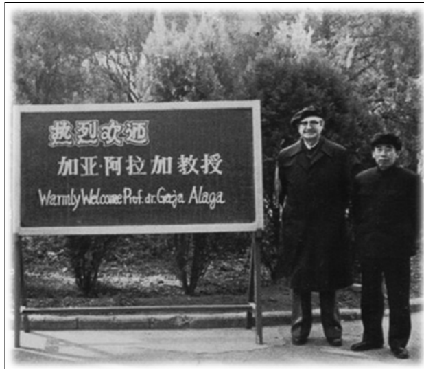
Slika 5. Posjet Gaje Alage Kini.

Akademik je bio izuzetno cijenjen i rado viđen na eminentnim svjetskim znanstvenim institucijama i sveučilištima, gdje je više puta boravio kao gostujući profesor i pozvani predavač. Često je bio vodeći i predsjedavajući na sjednicama znanstvenih skupova, kao i član mnogih međunarodnih savjetodavnih odbora.