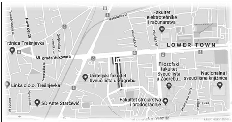
Slika 2. Lokacija Ulice Gaje Alage u Zagrebu

Zastavši u hodu, šetnjom malim, tihim ulicama dragog nam grada Zagreba, iznenada vidim naziv ulice s imenom i prezimenom jednog od meni najdražih profesora, tijekom mog studiranja Primijenjene matematike na prirodoslovno matematičkom fakultetu, sedamdesetih godina prošlog stoljeća. Sjećanja naviru, ostaje nezaboravan lik izuzetnog znanstvenika, profesora, studentima bliskog učitelja, koji je snažno utjecao ne samo na hrvatsku, već i na svjetsku znanstvenu baštinu.