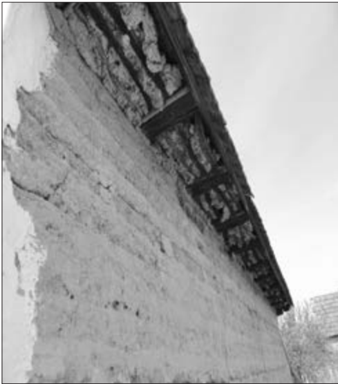
Slika 10. Vikleri/Vitleri na gredama. Vlasnik kuće nepoznat.

Kada su zidovi i strop bili gotovi, napravila se mješavina od ilovače i sitne plevl/plive (dobivena pri vršidbi žita, pljeva) zvana blato . Ta mješavina se radila tako da bi