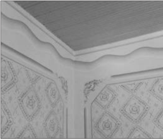
Slika 35. Mali cimer u kutu zidova. Nepoznati vlasnik kuće. Snimila Klara Tončić u Sonti, 2016. godine.

nji špigl bi se i bojao i dekorirao, primjerice, zvjezdicama i sličnim nebeskim motivima. Da bi se napravile pravilne štrafte uzima se konac duljine sobe, jedna osoba drži konac na jednoj strani sobe, a druga na drugoj. Zatim se konac povuče i otpusti kako bi ostavio trag za polaznu crtu na zidu. Molerka i kazivačica Evica Bartulov tvrdi kako je štrafta različite debljine skrivala sve mane moleraja i kako se radila zadnja, „kao porub na suknji“. U Plavni je ona morala biti crvene boje.