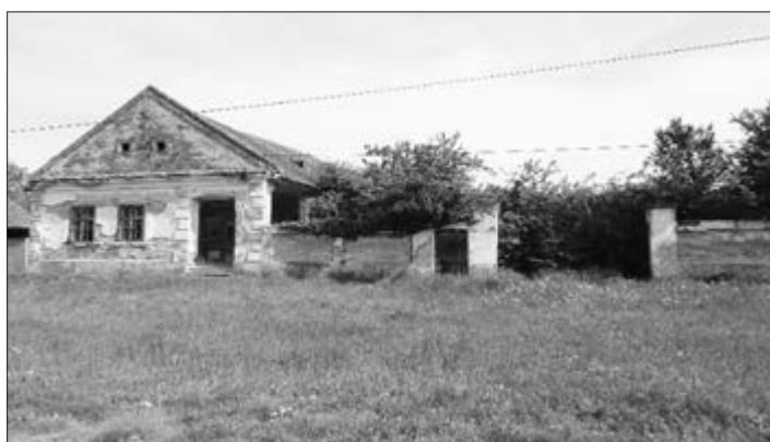
Slika 17. Napuštена kuća nabijača nepoznatog vlasnika. Vidljiva kapela/kapelica, jednokrilna vratašca kao ulaz u ganak. Snimila Klara Tončić u Plavni, 2016. godine.

Za ganak (Slika 16) bismo mogli reći da je karakteristični i neizostavni dio kuće nabijače. Radi se o hodniku koji prati duljinu kuće s unutarnje strane dvorišta od otprilike dva do tri metra širine, pod krovom koji je oslonjen na stupove i noseće zidove kuće. U ganak nekih kuća se ulazilo kroz takozvanu kapelu ili kapelicu (Slika 17 i 18), jednokrilna vratašca do kojih su vodile dvije ili tri stube na kojima se sjedilo i družilo tijekom ljetnih večeri. U Sonti se naziva vraca (usp. Andrašić 2010, 53). Kapelu možemo rijetko vidjeti na kućama nabijačama koje su se održale do danas.