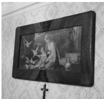
Slika 37. Slike sakralne tematike i raspelo na zidu. Nepoznata vlasnica. Snimila Klara Tončić u Sonti, 2016. godine.

Što se tiče dekoriranja zidova, osim molo- vanja , zidovi u pridnjoj sobi su bili ispunjeni slikama sakralne tematike s debelim, teškim drvenim okvirima. One su bile obješene iznad ili pored svakog kreveta u pridnjoj sobi , a prikazivali su Svetu obitelj i(li) neke svece (Slika 36). Uglavnom su te slike bile tipizirane i u svakoj kući su bile iste (Srce Marijino, Srce Isusovo). One su bile predmet prodaje, odnosno trampe putujućih trgovaca, takozvanih robara . Neki kazivači kažu da su se svete slike velikog formata dobivale kao svadbeni dar. Iznad prozora je bilo obično i jedno raspelo. Neki kazivači kažu da je u svakoj prostoriji bio križ: