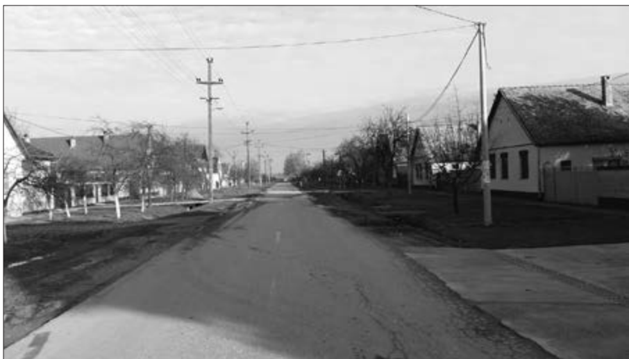
Slika 2. Geometrijski izgled ulice u Plavni. Snimila Klara Tončić 2016. godine.

i sojenica. Radi se o kućama manjih dimenzija, jednokatnica, koje se i dalje mogu vidjeti na području Baranje, Slavonije i Vojvodine, vrlo često u neodržavanom ili napuštenom stanju. Preteča kućama nabijačama zapravo su bile građevine od pruća prekrivena blatom. Kuće nabijače su svoje ime dobile prema specifičnom načinu gradnje, nabijanju zemlje. Da bi se razumjelo zašto su tadašnji stanovnici Bačke pokrajine kuće gradili upravo nabijanjem zemlje, treba imati na umu da su uvjeti života