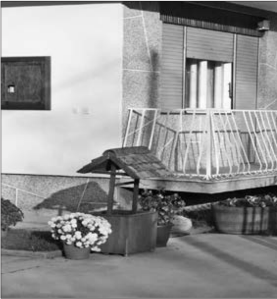
Slika 42. Replika bunara s drvenim sikom. Nepoznati vlasnik kuće. u Baču, 2016. godine.

ni građevni materijal. Najviše se ipak preinaka radilo od sedamdesetih godina 20. stoljeća nadalje jer se tad počela pojavljivati i plastika i suvremeniji materijal. Osim veće kvalitete modernijih materijala i veće funkcionalnosti, u kazivanjima se pojavljuje i pitanje estetike. Tako Ana Đirki iz Bača pojašnjava: