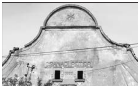
Slika 12. Zabat s kiblom i badžama. Vidljiv ukras i godina izgradnje. u Baču, 2016. godine.

strop, plafon. Te grede su bile debljine 4-5 cm, a dugačke desetak metara. Te grede su se radile od bagrema i u četvrtasti oblik ih je oblikovao majstor bradvom , kratkom sje-kiricom s malom drškom za obrađivanje drva. Udaljenost između greda je bila 90 cm.