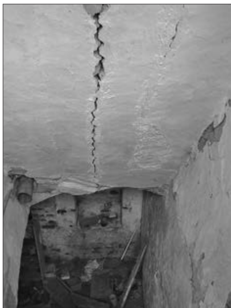
Slika 30. Ulaz u podrum iz ganka. Snimila Klara Tončić u kući nepoznatog vlasnika, Plavna, 2016. godine.