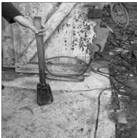
Slika 4. Rmpos/Rampoš. Vlasništvo Ivana Andrašića iz Sonte. Snimila Klara Tončić u Sonti, 2016. godine.

Kuće nabijače su bile visoke do 2,5 metra, a zidovi su bili debljine 60-80 cm. Veličina buduće kuće je ovisila o financijskim mogućnostima i o veličini zemljišta vlasnika te o brojnosti ukućana. Za temelj kuće, fundament , koristila se cigla ili barem čerpić 5 . Postojale su dvije veličine cigle; velika švapska cigla (30x15 cm) i mala