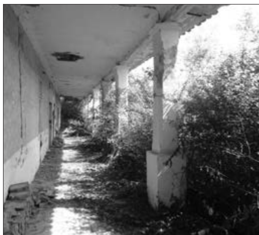
Slika 16. Ganak napuštene kuće nabijače nepoznatog vlasnika. Snimila Klara Tončić u Plavni, 2016. godine.

ka u dodatnu sobu, o čemu će biti riječ u sljedećem poglavlju. Podataka o naknadnoj potrebi proširivanja stambenog prostora nema ni u Andrašićevoj knjizi. Što se tiče samih dimenzija kuće i prostorija, kuće nabijače su bile manjih dimenzija. Kazivač Stjepan Fuks iz Bača navodi kako su prednja i stražnja prostorija bile duge šest metara, a široke četiri i pol metara dok je srednja prostorija, odnosno kuhinja bila nešto manja, duga četiri metara. Prema kućama koje sam imala prilike vidjeti na terenu, čini mi se kako ti navodi ipak nisu bili pravilo i kako su se dimenzije prostorija razlikovale od kuće do kuće, ovisno o veličini zemljišta.