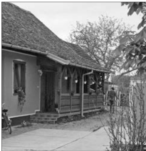
Slika 45. Trijem sličan ganku. Nepoznat vlasnik kuće.  u Baču, 2016. godine.

Iz ovih svih preinaka je vidljivo kako se nije nastojalo očuvati stare kuće već ih se, čim se bilo u financijskim mogućnostima, moderniziralo i zamijenilo