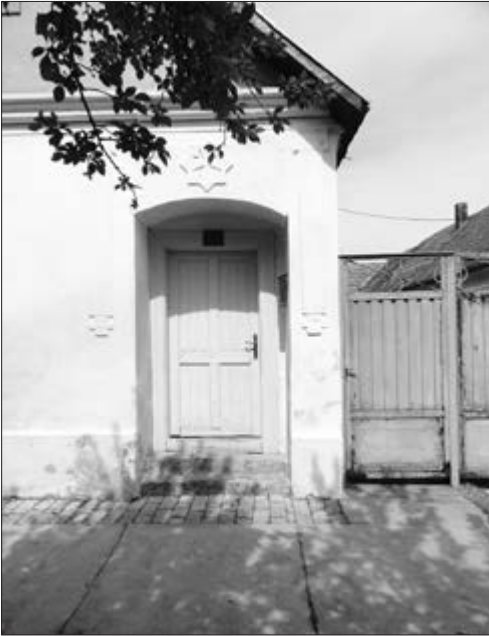
Slika 18. Kapela/kapelica. u Plavni, 2016. godine.

Kazivač Stjepan Fuks navodi kako su ukućani kroz kapelu prolazili samo kada su bili lijepo odjeveni, prilikom odlaska u crkvu i slično. Kapela se češće mogla vidjeti u Plavni ili Bođanima nego u Baču (Slika 18), s obzirom na to da je Bač kao urbana sredina imao drukčiju strukturu stanovništva; ondje je bio veći broj Švaba koji nisu prakticirali gradnju kapela . Pokraj kapela je bila odvojena velika dvokrilna kapija visine oko 4 metara, prvobitno izrađena od drva koje je kasnije, šezdesetih, sedamdesetih i osamdesetih godina zamijenjeno željezom. Neke kuće su imale samo veliku kapiju , a danas je prava rijetkost vidjeti drvenu kapiju .