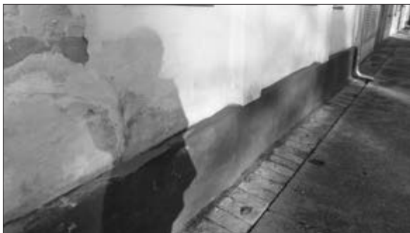
Slika 13. Cokla na kući. Vlasnik kuće je Ivan Broža. Snimila Klara Tončić u Plavni, 2016. godine.

strop, plafon. Te grede su bile debljine 4-5 cm, a dugačke desetak metara. Te grede su se radile od bagrema i u četvrtasti oblik ih je oblikovao majstor bradvom , kratkom sje-kiricom s malom drškom za obrađivanje drva. Udaljenost između greda je bila 90 cm.