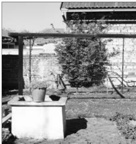
Slika 27. Bunar sa sikom u dvorištu Etno Didine kuće u Baču. Vlasnici Stjepan i Stanka Čoban.

Svaka kuća je u dvorištu imala i svoj bunar. Neke siromašnije kuće znale su dijeliti jedan zajednički bunar koji je bio između te dvije kuće. Bunari su se ručno kopali; kopalo se ukrug u promjeru od otprilike jedan metar malom kraćom lopatom što dublje se moglo. Kada se došlo do vode, majstor bi postavljao na dno šablonu od dasaka i onda bi na to zidao ciglu kako se ne bi sve urušilo. Bunar je obično umjesto lanca