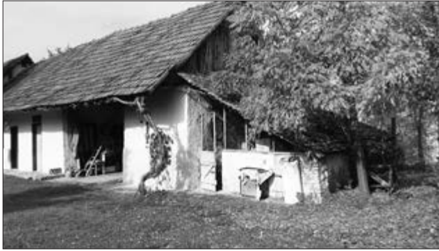
Slika 25. Henkšupa. Vlasnica Ana Đirki iz Bača. Snimila Klara Tončić u Baču, 2016. godine.

vrbe, šibljem, itd. Dvorište je većinom bilo podijeljeno na dva ili tri dijela; pridnje , sridnje i stražnje dvorište (Slika 24). Prednje dvorište, baštica (Bač)/ baščica (Plavna) je bilo predviđeno za uzgoj cvijeća, povrtnjak i voćke dok je srednje i stražnje dvorište bilo namijenjeno za držanje raznih domaćih životinja (kokoši, patke, konji, krave, svinje, ovce kada nisu bile na polju...). Ta dva dijela bila su fizički odvojena ogradom kako životinje ne bi uništile biljke u prednjem dvorištu, a ponekad su bila odvojena fiktivno, imaginarnom crtom koja je mogla biti ucrtana u zemlju, a koja bi označavala među ta dva područja. Zadnje dvorište je bilo otvorenog tipa zbog životinja. Prednji dio dvorišta je bio mjesto raznih poljoprivrednih aktivnosti poput sušenja graha ili tucanja mahuna vilama, a u stražnjem dvorištu su se radili „prljaviji“ poslovi poput svinjokolje . Na nekim imanjima je rupa gdje se odlagalo gnojivo, đubrište , bilo u zadnjem dijelu stražnjeg dvorišta, što dalje od kuće, a u nekima se nalazilo u prednjem dvorištu. Kazivačica Ana Đirki iz Bača se prisjeća kako je u njenom dvorištu bio i vinograd. Neke kuće koje su imale veoma malo dvorište, cijelo su dvorište namijenile za uzgoj domaćih životinja, a povrtnjak i voćnjak se obrađivao na zemlji oko sela koji se nazivao jaroš .