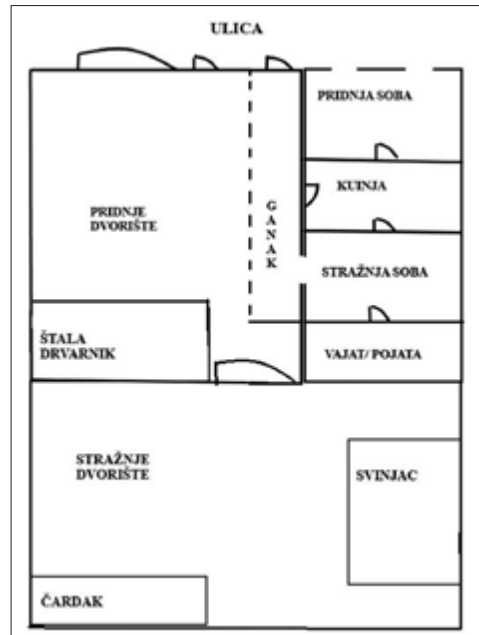
Crtež 2. Tlocrt kuće nabijače na lakat, štala i drvarnik su na kuću spojeni krovom. Izradila Klara Tončić, 2018. godine.

prostorije iza stražnje sobe koju su zvali stražnja kuinja . U tom slučaju bi se prva kuhinja zvala srednja kuinja ili pridnja kuinja koja je bila malo svečanija i urednija od stražnje. Ako se imalo dvije kuhinje, kuhalo se u stražnjoj, dok je prednja bila više za primanje gostiju. U slučaju dvije kuhinje je vajat bio tek iza stražnje kuinje , a mogao je biti i odvojen od kuće (vidi crtež 3). Taj raspored „četiri prostorije plus dodatci“ je bio učestao u Plavni, dok su kazivači iz Bača i Bođana uglavnom pričali o tri osnovne prostorije. Također, kazivači nisu spominjali da se tijekom vremena javila potreba proširivanja stambenog prostora već su broj i dimenzije prostorija u kući ovisile o financijskoj mogućnosti i