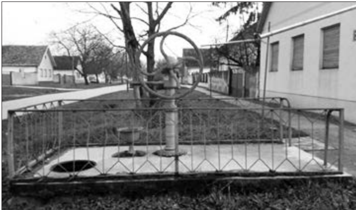
Slika 28. Selski/artejski bunar u Plavni. Nepoznata godina izgradnje. Snimila Klara Tončić u Plavni, 2016. godine.

Prema navodima kazivača, voda iz bunara je bila kvalitetna i pitka; koristila se za sve, do pojave bušenog artejskog (u Plavni nazivani i selski bunari ) (Slika 28), odnosno arteškog bunara 7 (krajem pedesetih u Baču, pedeset i sedme godine u Bođanima,