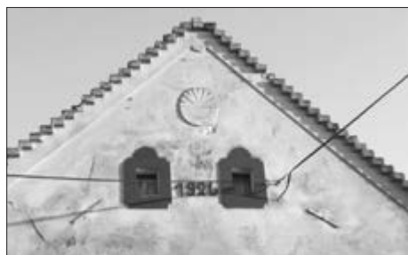
Slika 11. Zabat s kiblom i badžama. Vidljiv ukras i godina izgradnje. Snimila Klara Tončić u Baču, 2016. godine.