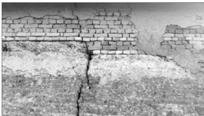
Slika 7. Kuća nepoznatog vlasnika gdje je vidljivo blato kojim se namazivao zid.