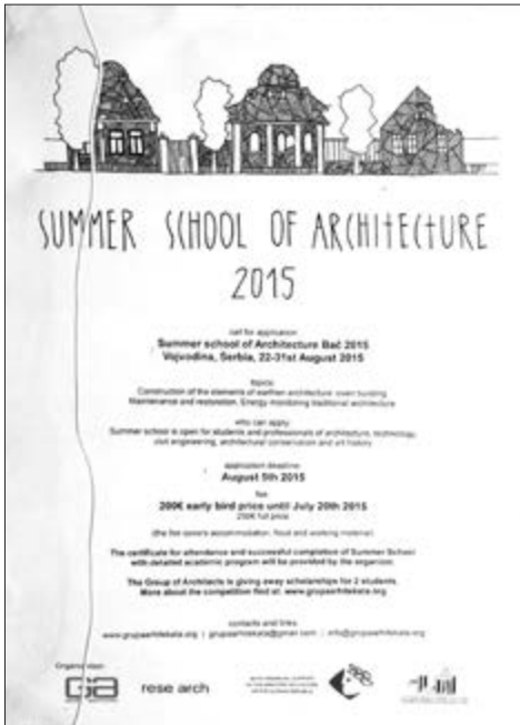
Slika 46. Letak za ljetnu školu arhitekture organizirane u Etno Didinoj kući u Baču.