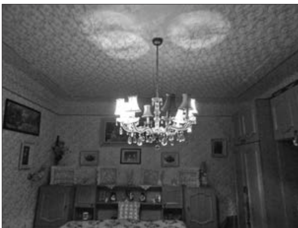
Slika 34. Molovanje na špiглу. Vlasnica kuće Marija Klinovski iz Plavne. Snimila Klara Tončić u Plavni, 2016. godine.

Prije molovanja nisu se dekorirali zidovi kuće nabijače , jednostavno su se bili okrećili. Dekoriranje zidova je zapravo u praktičnoj namjeri počelo da se prikriju mrlje na zidovima nastale ubijanjem brojnih muha. Uzela bi se boja i zatim bi se perajicom poprskao prljavi zid da se ne bi moralo krečiti svake godine. Boje su bile u prahu i miješale s vodom i mlijekom, nije bilo puno izbora u odabiru boja. Kasnije, polovicom 20. stoljeća su se pojavili i moleri , majstori soboslikari koji su bili školovani i poznavali tehniku molovanja i koji su na taj način dekorirali zidove. Kada su se oni pojavili, svi su svoje zidove počeli molovati . Danas to ovisi o ukusu ukućana. Dok još nisu postojali valjci koristio se karton na kojem su bili izbušeni uzorci koji su se htjeli prenijeti na zid. Pojavom valjaka i napredovanjem tehnike proširio se i izbor boja, a iznimno je moderno bilo molovati u zlatu, srebru ili bakru (Slika 33). Te