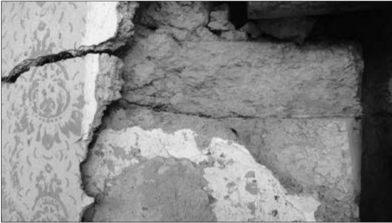
Slika 5. Slama između slojeva naboja.

(25x12 cm). Za fundament se na mjestima budućih zidova prokopalo 50-60-ak cm u zemlju i stavio red velikih ili malih cigli ili ćerpića . Između redova cigli posipao se pijesak ili usitnjena zemlja kao vezivno sredstvo. Ukoliko vlasnik nije imao mogućnosti nabaviti cigle ili ćerpiće za fundament , koristio se obični naboj za temelj; neki kazivači tvrde da su vidjeli kuće nabijače koje nisu imale uopće temelja, već se samo izvadilo pola metra zemlje pa se počelo graditi „zemljom na zemlju“.