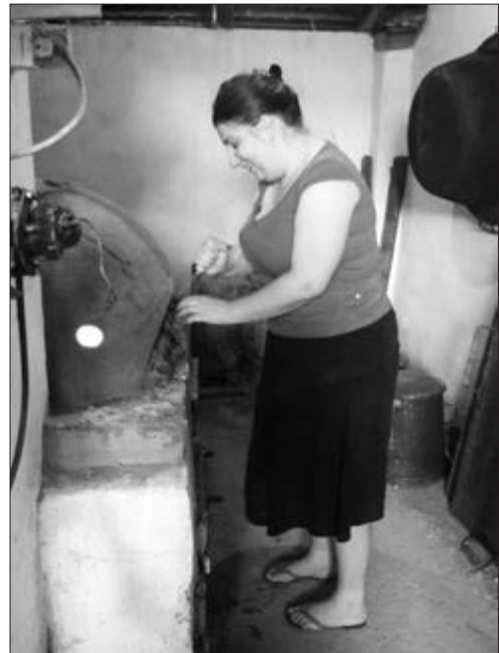
Slika 47. U sklopu ljetne škole arhitekture sudionici su izrađivali krušnu peć od naboja.

EtnoDidinaKuca/photos/a.457195864295082.120690.457173184297350/1120284721319523/?type=3&theater)