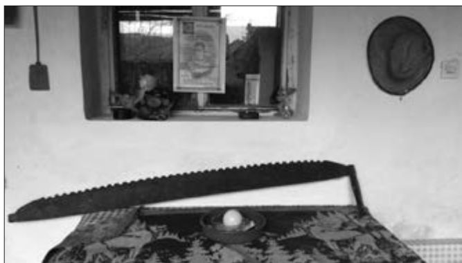
Slika 6. Testera (nedostaje jedna drška na lijevoj strani). Vlasništvo Stjepana Čobana iz Bača.