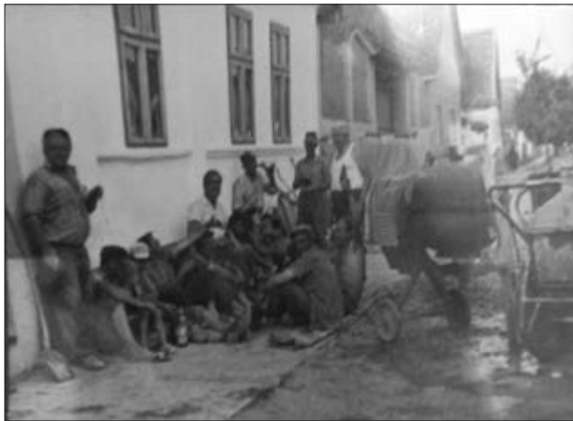
Slika 3. Moba. Godina i mjesto nepoznato. Fotografija je vlasništvo Kaje Pelajić iz Plavne. Snimila Klara Tončić u Plavni, 2016. godine.

U šokačkim kućama nabijačama je uvijek živjelo po tri generacije. Kuću je najčešće naslijedio onaj sin koji je ostao s roditeljima. Kćeri su nakon udaje otišle kao snaje (snahe) živjeti u muževu kuću, dok su sinovi ostali s roditeljima. Ako je bilo dva sina, onda bi svi zajedno živjeli u istoj kući dok onaj koji se prvi oženio ne bi kupio ili sebi izgradio novu kuću. U tom slučaju cijela bi obitelj štedjela novac i zemljarila (obrađivala tuđu zemlju) kako bi omogućila oženjenom sinu izgraditi vlastitu kuću. Ukoliko je otac bio imućniji, kupio bi sinu zemljište na kojem je on mogao izgraditi kuću. Ako je bilo više sinova, kuću je naslijedio sin po zaslugi, odnosno onaj koji je skrbio o roditeljima. U iznimnim slučajevima, ako je snaha bila bogata ili je bila jedinica, muž bi se doselio nakon ženidbe u njenu kuću i živio s njenim roditeljima.