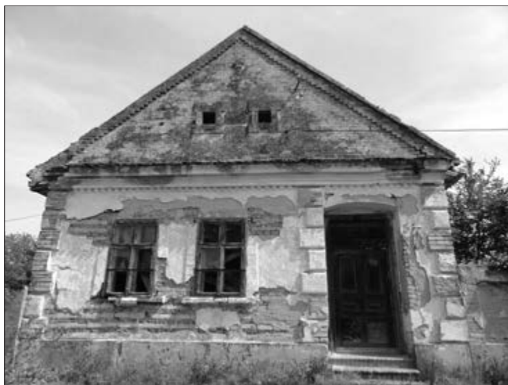
Slika 1. Tipični izgled kuće nabijače s dva dvokrilna prozora „pridnje sobe” koji gledaju na ulicu. Vlasnik kuće nepoznat. Snimila Klara Tončić u Plavni, 2016. godine.

i sojenica. Radi se o kućama manjih dimenzija, jednokatnica, koje se i dalje mogu vidjeti na području Baranje, Slavonije i Vojvodine, vrlo često u neodržavanom ili napuštenom stanju. Preteča kućama nabijačama zapravo su bile građevine od pruća prekrivena blatom. Kuće nabijače su svoje ime dobile prema specifičnom načinu gradnje, nabijanju zemlje. Da bi se razumjelo zašto su tadašnji stanovnici Bačke pokrajine kuće gradili upravo nabijanjem zemlje, treba imati na umu da su uvjeti života