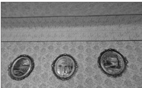
Slika 33. Molovanje srebrnim, zlatnim i brončanim bojama. Vlasnica kuće Marija Klinovski iz Plavne. Snimila Klara Tončić u Plavni, 2016. godine.

Prije molovanja nisu se dekorirali zidovi kuće nabijače , jednostavno su se bili okrećili. Dekoriranje zidova je zapravo u praktičnoj namjeri počelo da se prikriju mrlje na zidovima nastale ubijanjem brojnih muha. Uzela bi se boja i zatim bi se perajicom poprskao prljavi zid da se ne bi moralo krečiti svake godine. Boje su bile u prahu i miješale s vodom i mlijekom, nije bilo puno izbora u odabiru boja. Kasnije, polovicom 20. stoljeća su se pojavili i moleri , majstori soboslikari koji su bili školovani i poznavali tehniku molovanja i koji su na taj način dekorirali zidove. Kada su se oni pojavili, svi su svoje zidove počeli molovati . Danas to ovisi o ukusu ukućana. Dok još nisu postojali valjci koristio se karton na kojem su bili izbušeni uzorci koji su se htjeli prenijeti na zid. Pojavom valjaka i napredovanjem tehnike proširio se i izbor boja, a iznimno je moderno bilo molovati u zlatu, srebru ili bakru (Slika 33). Te