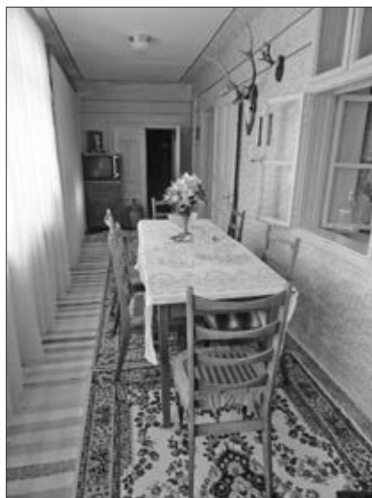
Slika 40. Zatvoreni ganak, odnosno gank-sobalsobica. Vlasnica kuće Marija Klinovski iz Plavne. Snimila Klara Tončić u Plavni, 2016. godine.