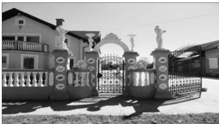
Slika 44. Preuzimanje motiva molovanja u modernoj gradnji. Snimila Klara Tončić u Vajskoj, 2016. godine.

I Stipan Dujan iz Plavne naglašava važnost unutarnjeg uređenja kuće: