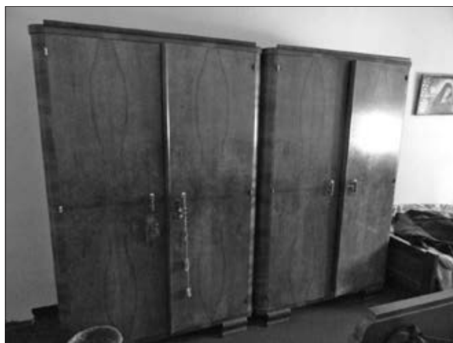
Slika 20. Šifonjeri u Etno Didinoj kući u Baču. Vlasnici Stjepan i Stanka Čoban.