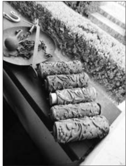
Slika 32. Gumeni valjci za molovanje s raznim mustrama. Vlasnici Stjepan i Stanka Čoban. Snimila Klara Tončić u Baču, 2016. godine.

U podrumu se držalo vino i raki-ja, cvijeće te povrće iz povrtnjaka poput