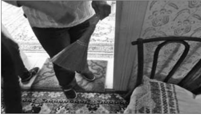
Slika 9. Perajica. Vlasnica Marija Klinovski iz Plavne. Snimila Klara Tončić u Plavni, 2016. godine.

Kako bi ostala rupa za prozore i vrata, ostavilo se prostora za njih pomoću gre-dica, natprozornica za pendžer (prozor) i natvratnica za vrata. Te gredice su bile od bagrema jer su trebale biti dovoljno čvrste da izdrže naboj koji se stavljao na njih. Nakon što su se zidovi nabili do kraja, na mjestu gdje su natprozornice i natvratnica sjekirom i testerom (pila s dvije ručke) oblikovali su se prorezi za vrata i dva prozora koja su gledala na cestu (Slika 6). Kuće koje su kasnije rađene su imale još po jedan prozor u svakoj prostoriji koji je gledao na ganak . Prozori su bili mali (zbog uštede energije) i dvokrilni.