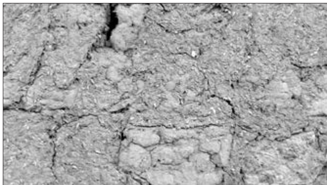
Slika 8. Blato namazano na naboju. Kuća nepoznatog vlasnika. Snimila Klara Tončić u Sonti, 2016. godine.