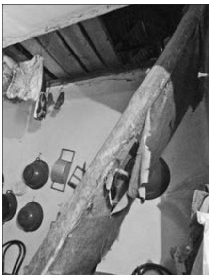
Slika 23. Lojtre u vajat u koje vode na tavan. Snimila Klara Tončić u kući Marice Andrić iz Plavne, 2016. godine.

Kada govorimo o higijeni, moramo imati na umu da je gradska voda uvedena na to područje krajem šezdesetih i početkom sedamdesetih godina tako da je dotad toalet bio ono što često nazivamo poljskim zahodom . Bio je dislociran od kuće minimalno deset metara što ga je smještalo u zadnji dio dvorišta. Poljski zahod , zvan i poljak je bio građen od drveta, a neki mještani su ga kasnije i zidali. Unatoč postojanju poljskog zahoda , neki kazivači se prisjećaju kako im je u djetinjstvu i svinjac katkad poslužio u istu svrhu. Što se tiče održavanje higijene tijela, stanovnici su se prali sapunima rađenima od svinjske masnoće, u lavorima ili koritima u kuhinji ili u dvorištu kada je bilo toplo. Dolaskom gradske vode odmah su se počela raditi kupatila , odnosno kupaonice s ugrađenim toaletom u kućama, tako da su poljski zahodi srušeni ili prenamijenjeni u kokošinjce i slično. Ona su se gradila uglavnom u stražnjem dijelu kuće, iza zadnje prostorije u nizu.