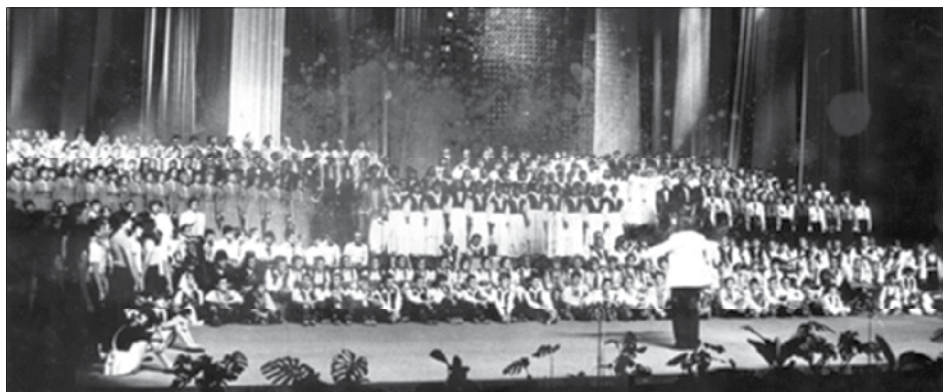
Slika 4. 21. konferencija UNESCO-a, Sava centar Beograd, 1980. godine. Snimio Marko Meštrović 2018. godine.

HKPD „Matija Gubec“ danas broji 420 članova, a rad se dovija u četiri sekcije, među kojima su dvije posvećene upravo tamburi – Veliki tamburaški orkestar i Ško-