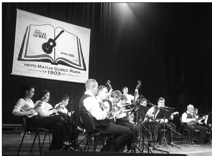
Slika 5. Svečani koncert povodom Dana društava 2017. godine. 6

godina, Društvo se uspjelo održati do danas. Večerašnji koncert je pokazao ono najbolje što oni imaju, a to je vrhunska tamburaška sekcija s veoma raznovrsnim repertoarom i, što je za mene veoma značajno, s brojnom publikom. Među njima nije bio samo dio hrvatske zajednice nego i većinskog naroda i drugih manjina, što pokazuje da je ova udruga respektirana u ovoj gradu.“ (Darabašić 2017: 24)