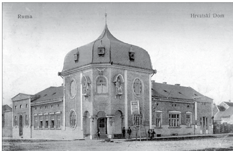
Slika 2. Izgled originalne zgrade Hrvatskog doma. 3

ljačka zadruga“. S obzirom na trenutni kontinuitet postojanja u trajanju od 116 godina, ovo je društvo jedno od najstarijih na području cijele Vojvodine. Na inicijativu organizacije „Hrvatski sokol“, godine 1909. otkupljeno je zemljište na kojem je tada započela gradnja zgrade Hrvatskog doma u centru Rume (Slika 2). Zgrada je sagrađena 1924. godine, a vlasništvo su međusobno dijelili: Hrvatski sokol, Hrvatska čitaonica, Hrvatska ratarska čitaonica, Hrvatska seljačka zadruga i Hrvatsko pjevačko društvo „Jedinstvo“. Kao pravni sljedbenik „Hrvatske ratarske čitaonice“ i HPD-a „Jedinstvo“, danas postoji jedino još Hrvatsko kulturno-prosvjetno društvo „Matija Gubec“ (ibid.).