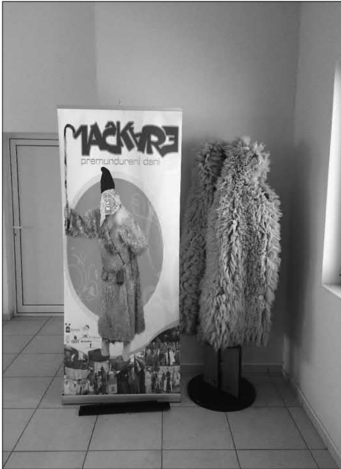
Slika 5. Oprema mačkara u Golubincima u prostorijama HKPD-a „Tomislav“. Snimio Robert Kapeš 2017. godine.

Ponegdje postoje i tradicijske maske koje se ne mogu mijenjati, već se samo prenose iz generacije u generaciju. Takvih maski ima u Golubincima, kao i naopako okrenutih kožuna , koje maskirana lica nose (Slika 5):