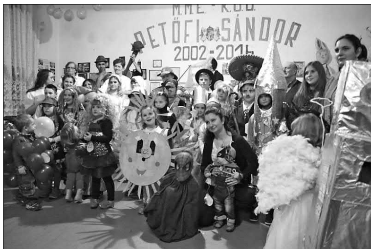
Slika 15. Maskenbal u Nikincima u veljači 2017. godine.

Poklone u Nikincima pribavlja župa koja je poklade i revitalizirala. Dodjeljuju se nagrade za tri najbolje maske, ali također i utješne nagrade tako da nijedno dijete ne bude zakinuto. Postoji nekoliko kategorija maski, odnosno djece: predškolska kategorija, djeca od 1. do 4. razreda bili su druga kategorija, zatim od 4. do 8. razreda kao treća kategorija (Slika 16).