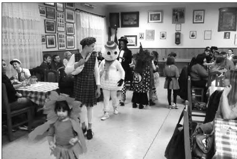
Slika 13. Karnevalska zabava u Rumi u veljači 2018. godine.

posebnih obilježja ili znakova u koje se kuće ulazilo, nego onako tko je htio po- častiti maškare. (Marko Mijić)