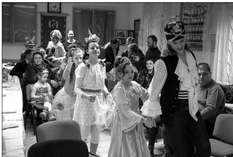
Slika 10. Karnevalska proslava u Petrovaradinu.

Posebnih pokladnih pjesama se ne sjećaju, osim bećarca: „Poklade su i ljudi su dani, ja ću ti mati ludovati!“ Vlasnik jednog kafića tada nudi i neka pića po jeftinijoj cijeni te se ljudi goste krafnama i kobicama koje su donijeli od kuće. Ivan Barat iz Srijemske Mitrovice komentira: Al to je bilo nešto novo i ljudi su voleli da se druže. Jako je bilo posećeno i sve. Sad u zadnje vreme to nešto slabo, to moram da kažem (Slika 12).