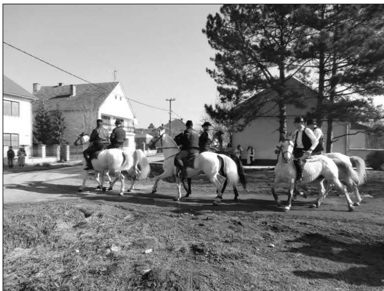
Slika 20. Defile konja prilikom pokladnog jahanja u Golubincima u veljači 2015. godine.