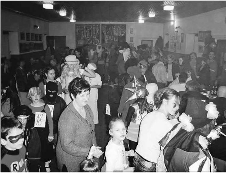
Slika 12. Karnevalska proslava u Srijemskoj Mitrovici u veljači 2007. godine.

U Rumi je tamburaški orkestar izvodio karakteristične pjesme srijemskog područja, svirala se popularna glazba, poput pjesama Zvonka Bogdana, ili pjesme hrvatskih tamburaških orkestara, a tamburaši su ujedno i pratili maskiranu povorku, šezdesetih godina 20. stoljeća, a danas sviraju na karnevalskim zabavama. Sve do Domovinskog rata maskirali su se i stari i mladi. U razdoblju oko Drugoga svjetskog rata bake bi dolazile na igranke , sjedile i promatrale svoje unuke i za koga će se jednog dana ženiti/udavati, odnosno, tražile su svojoj unučadi potencijalne kandidate za brak. Nakon toga, od sedamdesetih više su se maskirali stariji, nego djeca, i tako sve do Domovinskog rata nakon kojega su djeca postala glavni protagonisti pokladnih običaja u Rumi, dok su stariji gotovo u potpunosti zanemarili maskiranje (Slika 13).