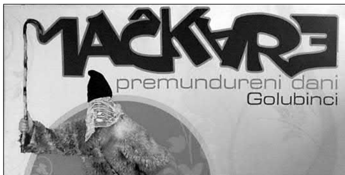
Slika 1. Promotivni natpis u prostorijama Hrvatskog kulturno-prosvjetnog društva „Tomislav“ u Golubincima.