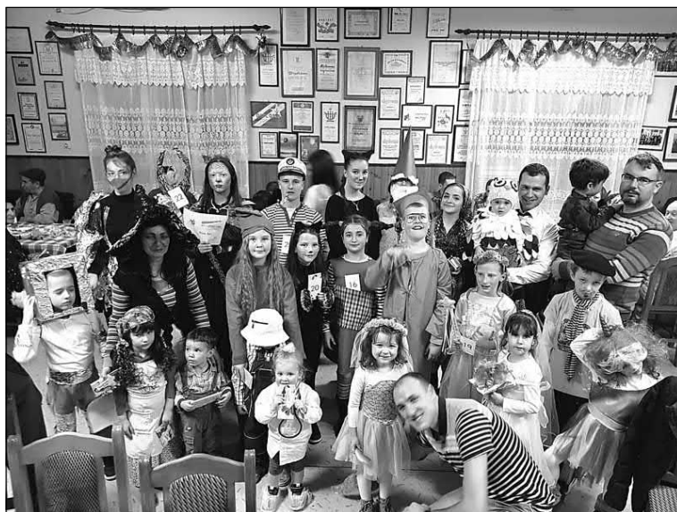
Slika 14. Podjela nagrada djeci na maskenbalu u Rumi u veljači 2019. godine.

Poklone u Nikincima pribavlja župa koja je poklade i revitalizirala. Dodjeljuju se nagrade za tri najbolje maske, ali također i utješne nagrade tako da nijedno dijete ne bude zakinuto. Postoji nekoliko kategorija maski, odnosno djece: predškolska kategorija, djeca od 1. do 4. razreda bili su druga kategorija, zatim od 4. do 8. razreda kao treća kategorija (Slika 16).