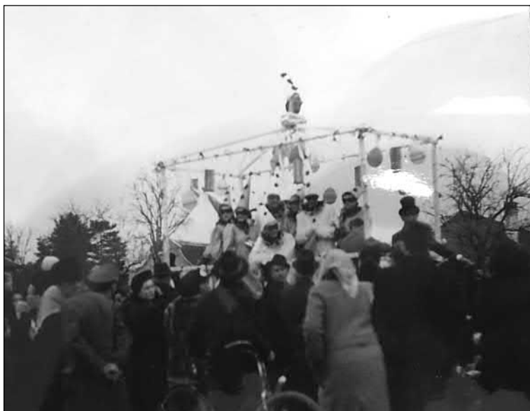
Slika 9. Karnevalska povorka u Petrovaradinu okupljena oko Princa karnevala, godina snimanja nepoznata.

U Rumi kazivači ističu da se u pokladno vrijeme piju kajsijovača i turgunja , odnosno, rakije od breskve i šljive. Svi kazivači navode da se meso ne jede za maškare i da za samu pokladnu igranku ne bude večere i hrane, nego se uz rakije od breskve i šljive piju uglavnom crno vino i sokovi. Kazivači spominju razna jela i pića te govore kako su se u kućama u pokladno vrijeme jele krofne , razvijače , bundevare (pite od bundeva), kupusare (pite od kupusa), razne štrudle i naposljetku domaći kolači, koji su bili najčešće od višanja. 6 U Petrovaradinu se nisu spominjala nikakva posebna jela i slastice, osim naravno, krafni. Njihov karneval, ili kako oni zovu, karnevalska veselica, obilježena je vinom i glazbom.