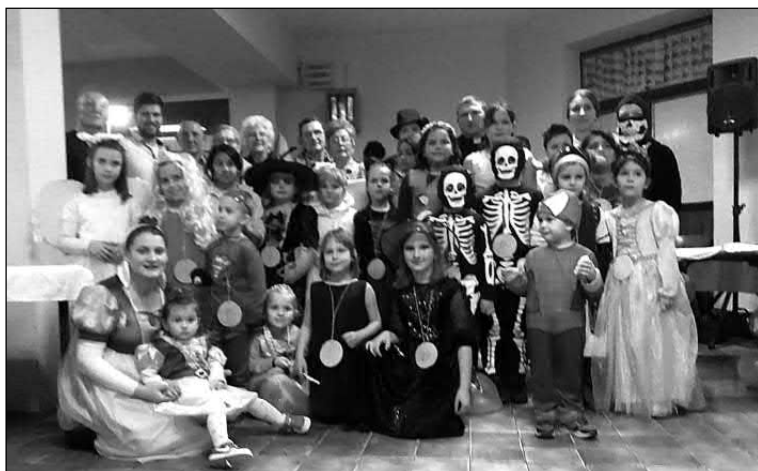
Slika 16. Djeca na maskenbalu u Nikincima, godina snimanja nepoznata.