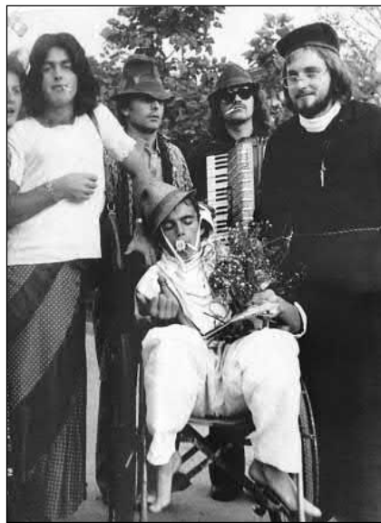
Slika 7. Ružne mačkare na golubinačkim maškarama. Fotografija je izložena u prostorijama HKPD-a „Tomislav“. Snimio Robert Kapeš 2017. godine.

i s tim spaljivanjem odnosi sve loše što se dogodilo u protekloj godini, na neki način se sva krivica prebacuje na tu pokladnu lutku, a to se naziva „oboravanje“ sela. Mitrovčani ne posjeduju pokladnu lutku koja se spaljivala na karnevalu, dok je Golubinčani posjeduju, pokažu na pozornici i zatim je spremaju za iduću godinu, ne spale ju. Kazivači iz Rume također se ne sjećaju takvih običaja: Ne, to ovdje nije običaj, ne znam da li je igdje u Vojvodini. Nema žrtvene lutke. U Golubincima postoji ružna maska. Jedan dan je bio posvećen tim strašnim maskama (Jurca Nikola, Ruma). To potvrđuje i drugi kazivač: Ne postoji