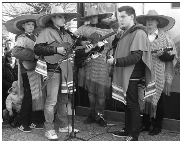
Slika 18. Nastup tamburaša na karnevalskoj proslavi u Golubincima u veljači 2017. godine.

U ponedjeljak se izvodi pokladno jahanje u svrhu očuvanja tradicije i običaja te jahači na konjima pozivaju ljude da ih prate u tom pokladnom jahanju koje također okuplja velik broj ljudi (Slika 19).