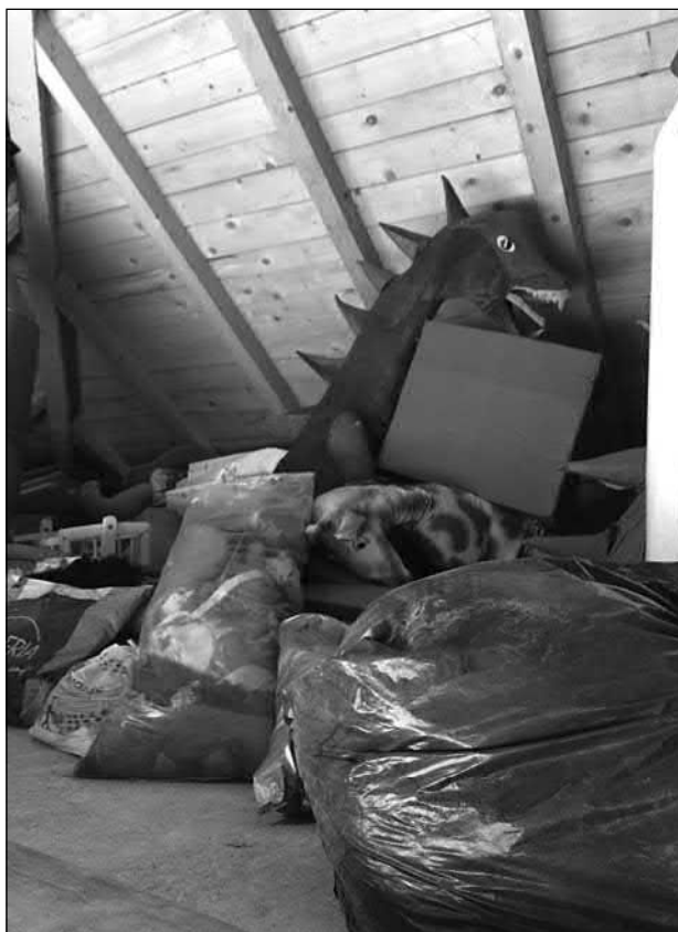
Slika 2. Golubinačka riznica maski.

i energije za sve ono što im slijedi u toj godini, izludiraju se, pomalo opiju i proslave kako treba. Prije, kada poklade nisu bile organizirane, već su ljudi samostalni odlazili od kuće do kuće, znalo je doći i do tučnjava zbog jednog krivog uštapa i slično, no otkad je to preuzela hrvatska zajednica, nastoje se takvi incidenti izbjeći. Golubinčani priželjkuju veću pomoć i pažnju od Republike Hrvatske: Kad bi bilo još neke veće pomoći od Republike Hrvatske moglo bi da se napravi baš neka velika atrakcija (Vlatko Čaćić). Unatoč tome, znala je doći Hrvatska radio televizija (HRT) koja je snimala prilog o njima, isto tako i Radio televizija Srbije (RTS), pojavljuju se i na Radiju Stare Pazove, Radio televiziji Vojvodina, reklamiraju se i preko Facebooka , a znali su organizirati i konferenciju za novinare na kojoj su se pojavili obučeni u maske, ili kako bi oni rekli, premundureni , najavljivali karneval i sve popratne sadržaje. Iz godine u godinu odaziv raste, te su zbog toga odlučili napraviti riznicu maski koje se skladište u tavanskim prostorijama u domu (Slika 2).