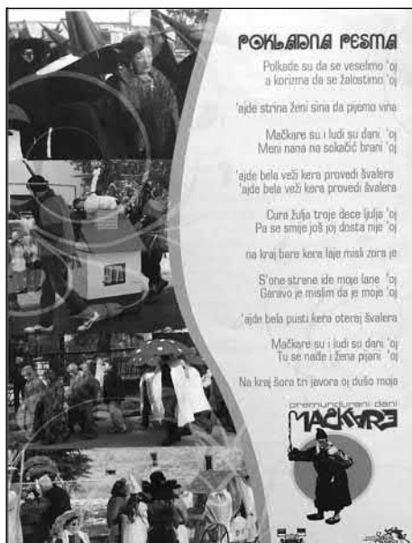
Slika 17. Pokladna pjesma na promotivnom letku karnevala.