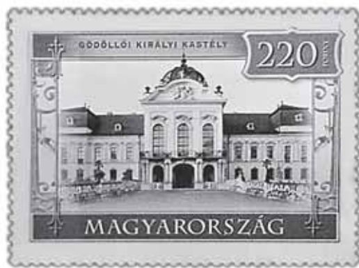
Slika 11. Poštanska marka izdana u povodu 240. godišnjice smrti Antuna Grašalkovića 38

Gdjekad se spominje kako je grof Grašalković proveo odnarođivanje Bačke, ili pak mađarizaciju i germanizaciju naseljavanjem Mađara, Nijemaca i Slovaka, te dijelom i Rusina na svoje posjede. 39 Nekima pritom ponajprije smeta to što su pridošlice redovno bili rimokatolici, ili pak grkokatolici (Rusini). Grof Grašalković kao gorljivi katolik doista je na svoja imanja kolonizirao uglavnom