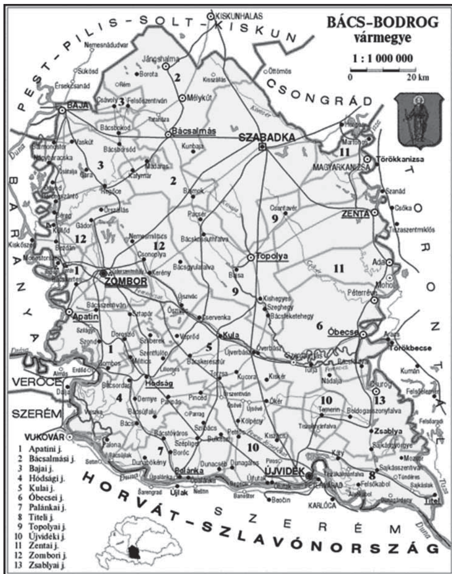
Slika 8. Zemljovid Bačko-bodroške županije*

deset okruga na čelu kojih je stajao povjerenik s ovlastima i unutar gradova. Bačka županija je uključena u Temišvarski okrug (temesvári kerület) zajedno sa županijama Temes, Torontál i Krassó, a na čije čelo je imenovan János Dezséri Bachó, dok je