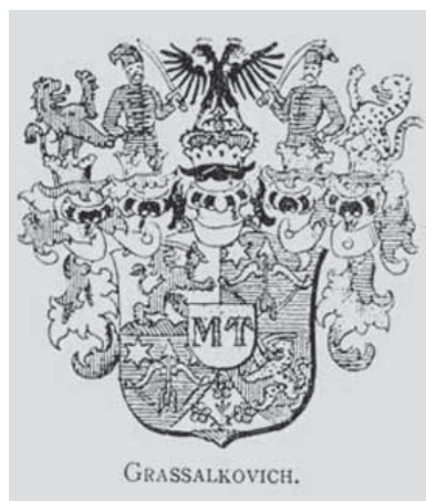
Slika 3. Grb obitelji Grašalković 10

bi 1751. bio imenovan za čuvara krune (od dva čuvara krune prvi je bio grof Miklós Esterházy), a poslije je dobio i vojni naslov nadzornika kraljevskih konjušnica (Herczog 1924). Usto je obnašao i dužnost unutarnjeg tajnog savjetnika, te velikog župana Aradske i Nogradske županije. Barunski naslov je dobio od kralja Karla III. u Laxenburgu 1736. godine, a u rang grofa je podignut od strane kraljice Marije Terezije u Beču 5. travnja 1743. kao Antun Grašalković „de Gyarak“. Naslov je dobio po općini Gyarak ( slov. Kmečovo, ranije Đarak) u županiji Nyitra, u današnjoj Slovačkoj. Tada je dobio i grb koji ukrašavaju inicijali kraljice Marije Terezije.