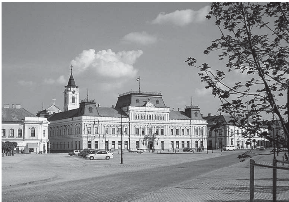
Slika 9. Palača Grašalković u Baji