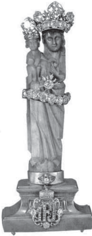
Slika 6. Kip Blažene Djevice Marije 27