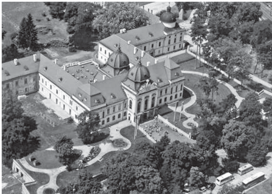
Slika 12. Grašalkovićeve dvorac u Gödöllő 43

Grof Grašalković kolonizirao je svoje posjede pridošlicama iz područja oko Rajne, te Trieria i Kölna koji su imali stanoviti imetak, a bili su vješti u pojedinim zanimanjima, ili su imali iskustva u gospodarenju. Oni su sa sobom donijeli razvijeni zapadnoeuropski način proizvodnje, te su svoja znanja prenijeli svim stanovnicima Grašalkovićeve posjeda, što je dovelo do procvata poljoprivredne proizvodnje. Naime, neproduktivni sustav zadruga utemeljen na zajedničkom zemljištu zamijenjen je sustavom individualnih, obiteljskih gospodarstava. Mnogi stručnjaci predbacuju Grašalkoviću da se ograničio isključivo na agrarnu proizvodnju, a da je na svojim posjedima industriju zapostavio, ali ne smiju se izgubiti iz vida prirodne datosti Ugarske koje su pogodovale upravo poljodjelstvu. Grof je držao da će na temeljima uspješne agrarne proizvodnje postupno jačati i industrija. Prvi plodovi planske kolonizacije i organizacije gospodarenja na svojim posjedima dozrijeli su 1760-ih godina kako u korist riznice, tako i u njegovu korist. Naime, kolonisti su s jedne strane plaćanjem poreza pridonosili svome feudalnome gospodarstvu i državnoj riznici, a s druge strane su svojim radom i umijećem sudjelovali u boljitku cijele države. Grof Grašalković je radio razborito, štedljivo, koristeći svaku postojeću mogućnost, ali i