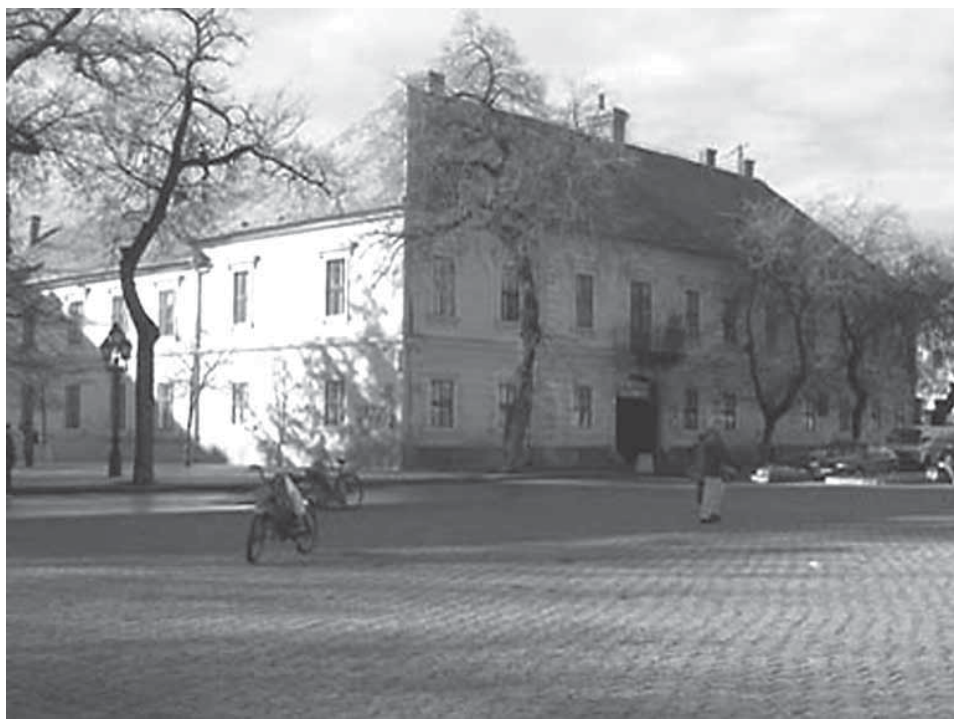
Slika 10. Grašalkovićeve palača u Somboru 37

poreza feudalnom gospodaru su oslobođeni godinu dana, a od plaćanja poreza županiji tri godine. Stranci su bili oslobođeni plaćanja poreza na rok od šest godina. U županijskom popisu poreznih obveznika prvi put se selo nalazi 1765., a 1769. je Tataháza županiji platila 137 forinta poreza. U naselju koje je 1772. bilo u vlasti Antuna II. Grašalkovića živjelo je 1777. godine 110 obitelji u 89 domova. Imali su 366 komada stoke za vuču i 100 konja. Po nacionalnom sastavu su bili Mađari.