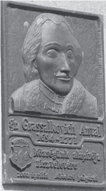
Slika 4. Spomen ploča s likom Antuna I. Grašalkovića, utemeljitelja Debrőa 12

XVII. stoljeća) odlučivao o pravnom statusu i vlasničkim odnosima na novooslobođenome području. Raniji vlasnici su trebali dokazati da su posjedi prije turske okupacije pripadali njihovim obiteljima. Ako to nisu bili u stanju, onda je pravo vlasništva prelazilo na Krunu, koja je posjede dodjeljivala „zaslužnim“ podanicima, među kojima je, dakako bio i grof Grašalković. Ivan Kukuljević je zapisao da je Antun Grašalković dobio i posjede slavonskog baruna Franje Trenka, zapovjednika slavskih (Trenkovih) pandura (Heka 2001, 246-247). Ovaj je naime, prvo u Beču nenadano uhićen i zatvoren u tamnicu, te osuđen od strane vojnoga suda na konfiskaciju imovine i doživotni zatvor. 13 Nakon dvije godine utamničenja je barun