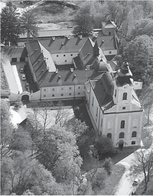
Slika 7. Crkva u Máriabesnyőu

u četiri naselja: Máriabesnyő, Budim, Mór i Tata, u kojima su im vraćeni njihovi stari, ali i vrlo zapušteni posjedi. Problem predstavlja manjak redovnika, pa su kapucini privremeno napustili Máriabesnyő, u kojemu je vacki biskup 2002. godine za župnika imenovao svjetovnog svećenika. Papa Benedikt XVI. je 2008. dodijelio crkvi u Máriabesnyőu rang basilicae minor . U njoj se nalazi obiteljska grobnica Grašalkovića u kojoj počiva i zadnji bračni par (knez Antun III. i Leopoldina Esterházy).