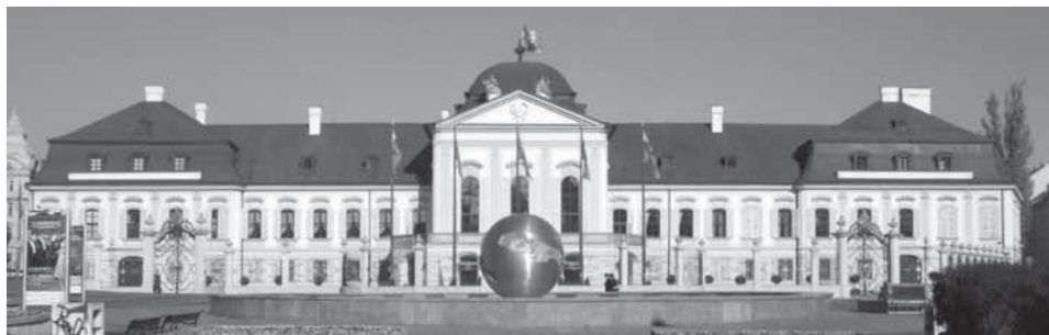
Slika 1. Grašalkovičeva palača u Bratislavi

o „Srbima katolicima“. 2 No, daleko najveći dio autora slaže se da su Grašalkovići podrijetlom bili Hrvati koji su bježeći pred Osmanlijama utočište našli na području Gornje Ugarske, najprije u okolici Soprona, a kasnije su se pomaknuli bliže Požunu i Trnavi u današnjoj Slovačkoj.